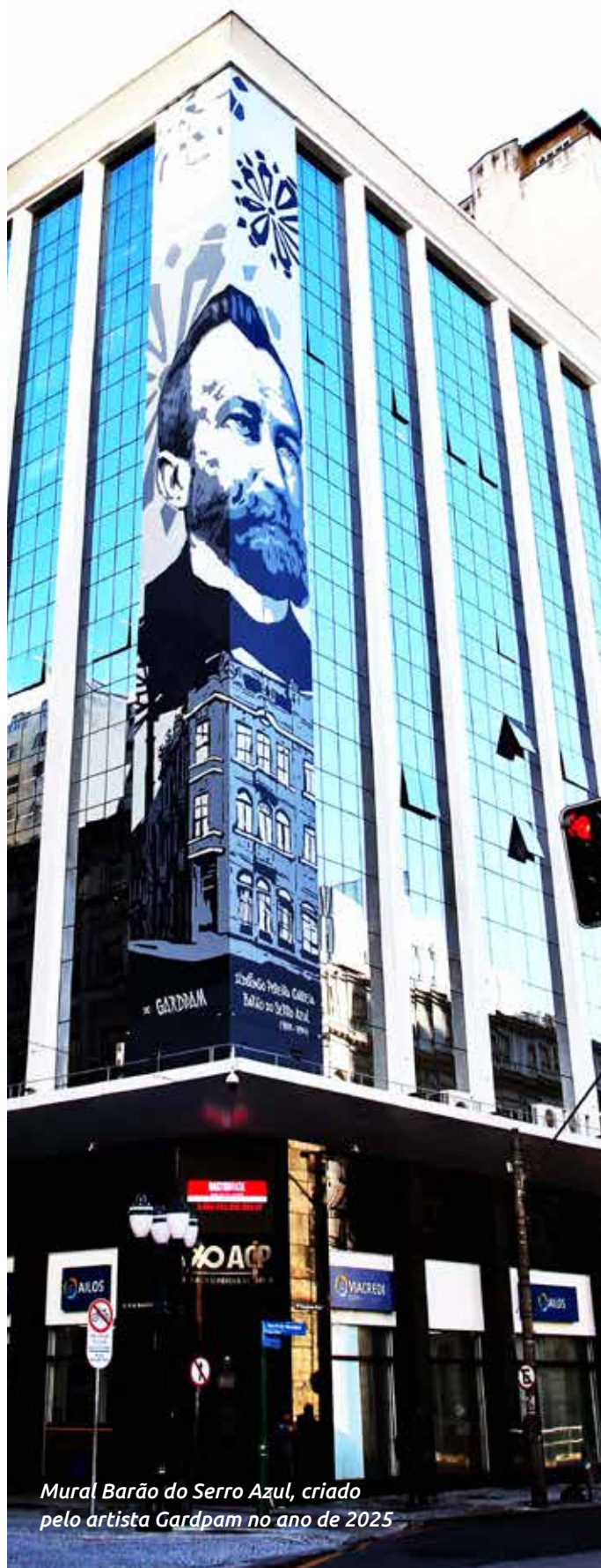
Mural Barão do Serro Azul, criado pelo artista Gardpam no ano de 2025

o espaço em palco de convivência cidadã e de dinamização econômica. A iniciativa, que agora conta também com edital para patrocínio da iniciativa privada, já se consolidou como símbolo da reocupação qualificada do espaço público, estimulando pertencimento e integração social.